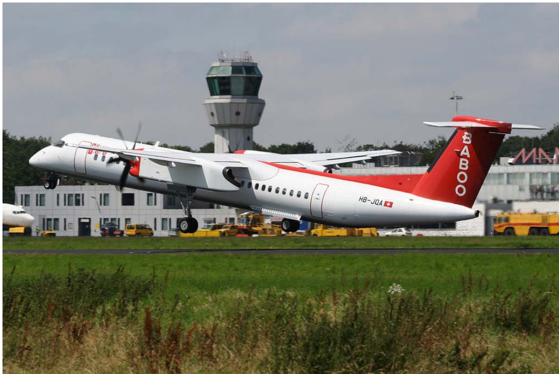
Het aanbod van vliegverkeer op Maastricht Aachen Airport is zeer gevarieerd